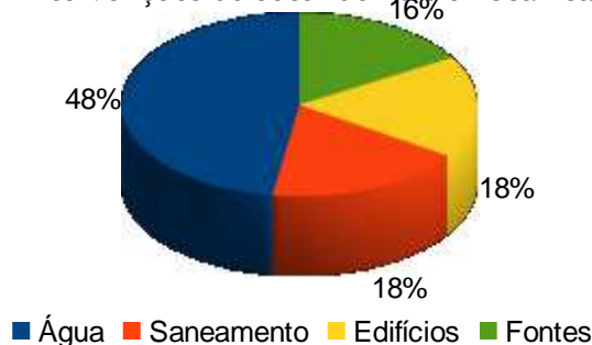
Gráfico II - Intervenções do setor de Eletromecânica por áreas